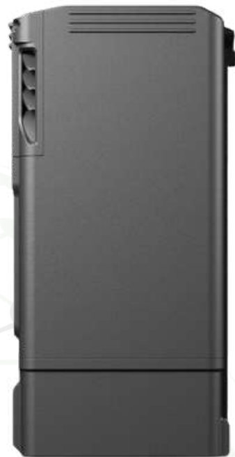
Batería TB-30 Para el Drone